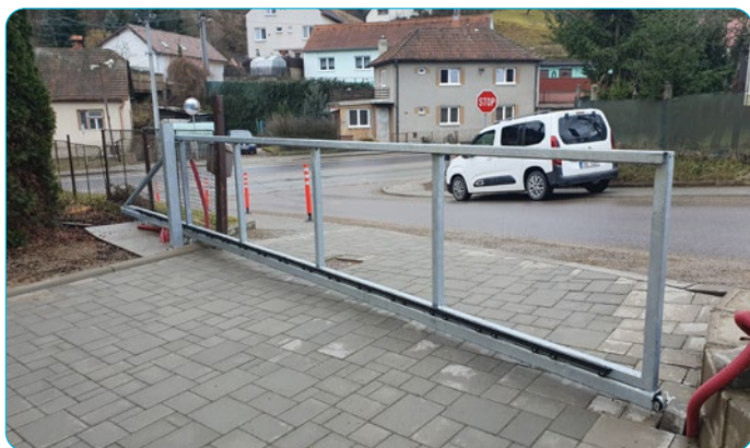
Výstavba nové pojezdové brány u naší školy.