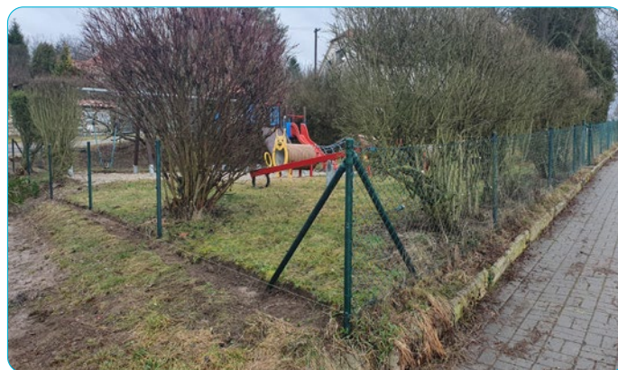
Probíhající oprava plotu dětského hřiště ve Svaté Kateřině.